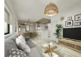
※床材・クロスの内装イメージカラーです