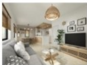
※床材・クロスの色イメージカラーです 内観イメージカラー：ナチュラル