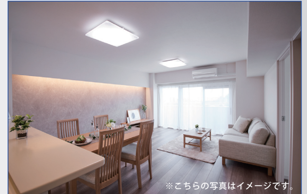
※こちらの写真はイメージです。