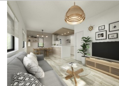
※床材・クロスイメージカラーです