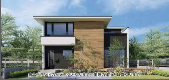
商品ブランドのイメージとなります。実際の建物とは異なります。