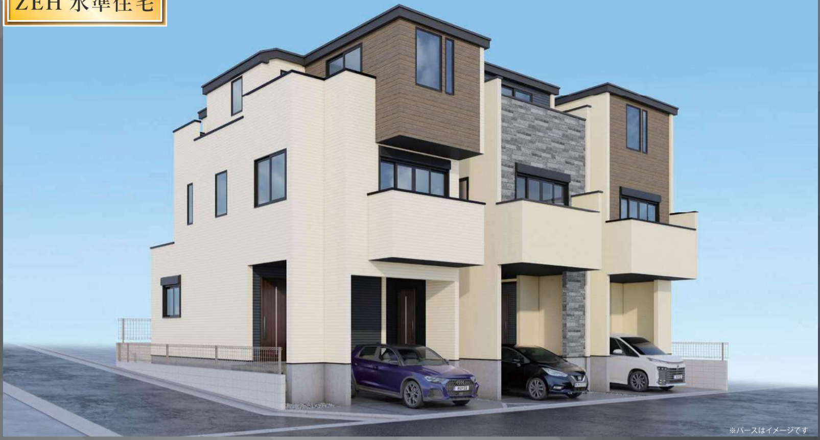
※パースはイメージです