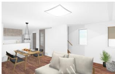
※図面を元に描き起こしたもので実際とは多少異なります。